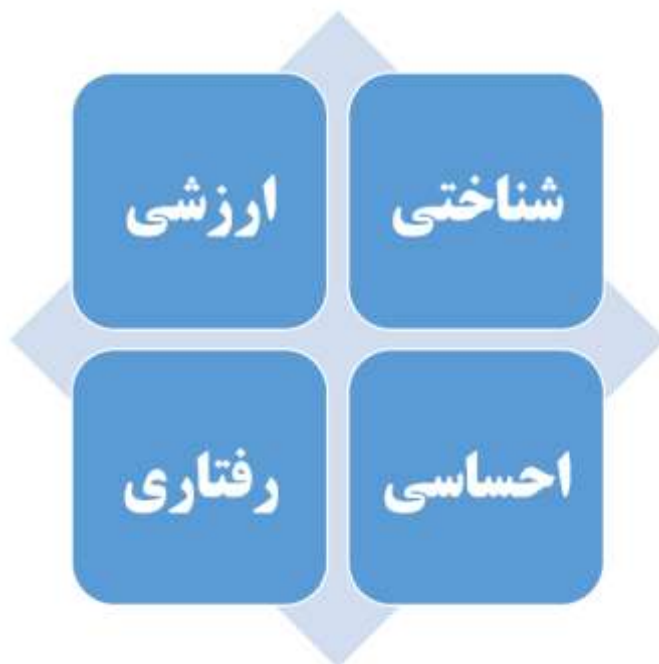
شکل ۱: مدل نوع شناسی هویت ملی

دفاع از تمامیت ارضی و اعتبار و عزت ملی کشور، مشارکت در امور اجتماعی و سیاسی