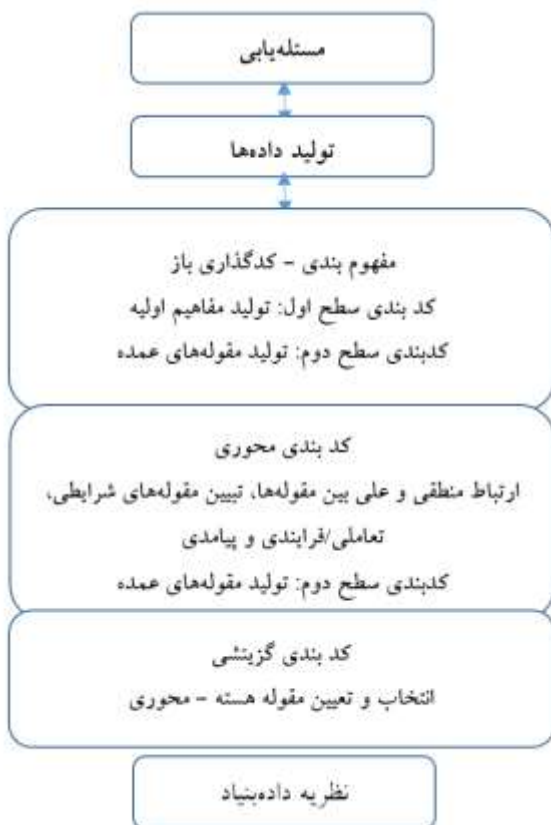
شکل ۳: مراحل نظریه‌پردازی داده‌بنیاد

مراحل انجام تحقیق با روش داده‌بنیاد در نمودار زیر نشان داده شده است (محمد پور، ۱۳۹۲: ۳۲۱).