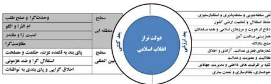
شکل ۲: شاخص‌های ارزشی و کنشی دولت تراز در سطح منطقه‌ای و بین‌الملل بر مبنای بیانیه گام دوم انقلاب

پایبند و نقش مؤثر و سازنده‌ای در ایجاد صلح و همزیستی مسالمت‌آمیز فرهنگی بین ملت‌ها ایفا خواهد کرد.