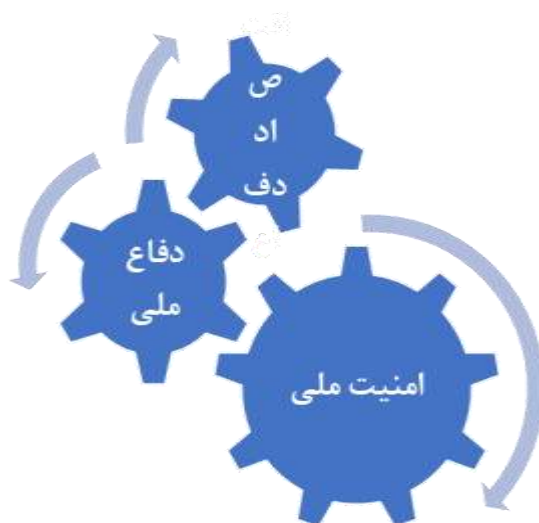
شکل ۲: الگوی اقتصاد دفاع و امنیت ملی