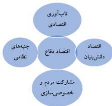
شکل ۱: ابعاد مختلف اقتصاد دفاع