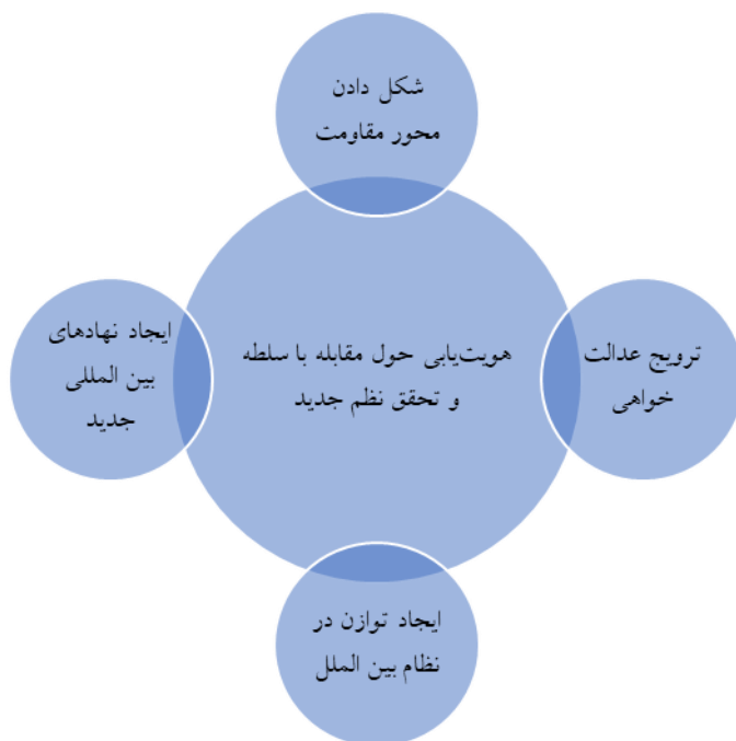
شکل ۱: گفتمان نظم هویت محور