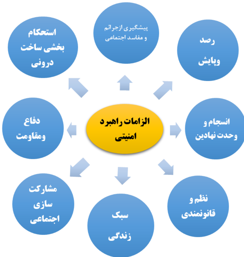
شکل ۱: هشت رویکرد در راستای ارتقای امنیت ملی

ملی قرار دارند. همچنین در کنار این محورها، می‌توان به دو عنصر مکمل دیگر نیز اشاره کرد: پایبندی به نظم و قانونمندی به‌عنوان پیش‌نیاز کارآمدی نظام و انسجام اجتماعی و نیز سبک زندگی مردم که ضامن حفظ مشروعیت و پایداری درونی نظام در برابر تهدیدات بیرونی است. درنهایت، تدوین این بخش، مبتنی بر بررسی ساختاریافته مجموعه‌ای از بیانات آیت‌الله خامنه‌ای با بهره‌گیری از روش تحلیلی مضمون‌محور انجام شده است. بدین ترتیب، مسیر دستیابی به این راهبردها از جنبه روشی نیز روشن و شفاف بوده و می‌تواند معیارهای علمی لازم در مطالعات مفهومی - راهبردی را برآورده نماید.