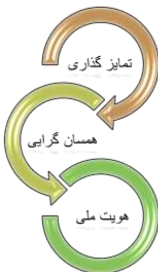
شکل ۲: سازه‌های مفهومی هویت ملی

سازه‌های مفهومی هویت ملی نیز از عناوین مهم در طرح مفهومی هویت ملی است که شامل تمایز گذاری با عناصر غیر هویتی و همسان گرایی با عناصر خود هویتی است