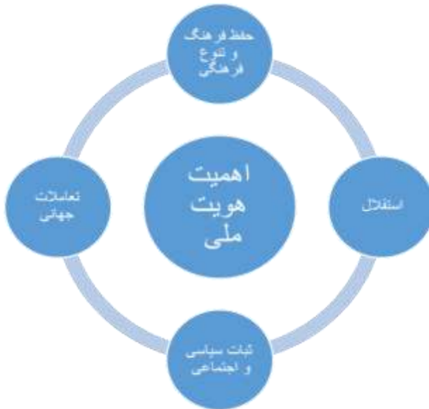
شکل ۱: اهمیت هویت ملی

ابعاد هویت ایرانی از مناظر گوناگونی مورد بررسی قرار داده شده است؛ که ترسیم ابعاد هفت‌گانه در عبارات زیر یکی از آن تقسیم‌بندی‌ها است: ۱- بعد اجتماعی ۲- بعد تاریخی ۳- بعد جغرافیایی ۴- بعد سیاسی ۵- بعد دینی ۶- بعد فرهنگی ۷- بعد زبانی و ادبی (حاجیان، ۱۳۷۹: ۱۹۳).